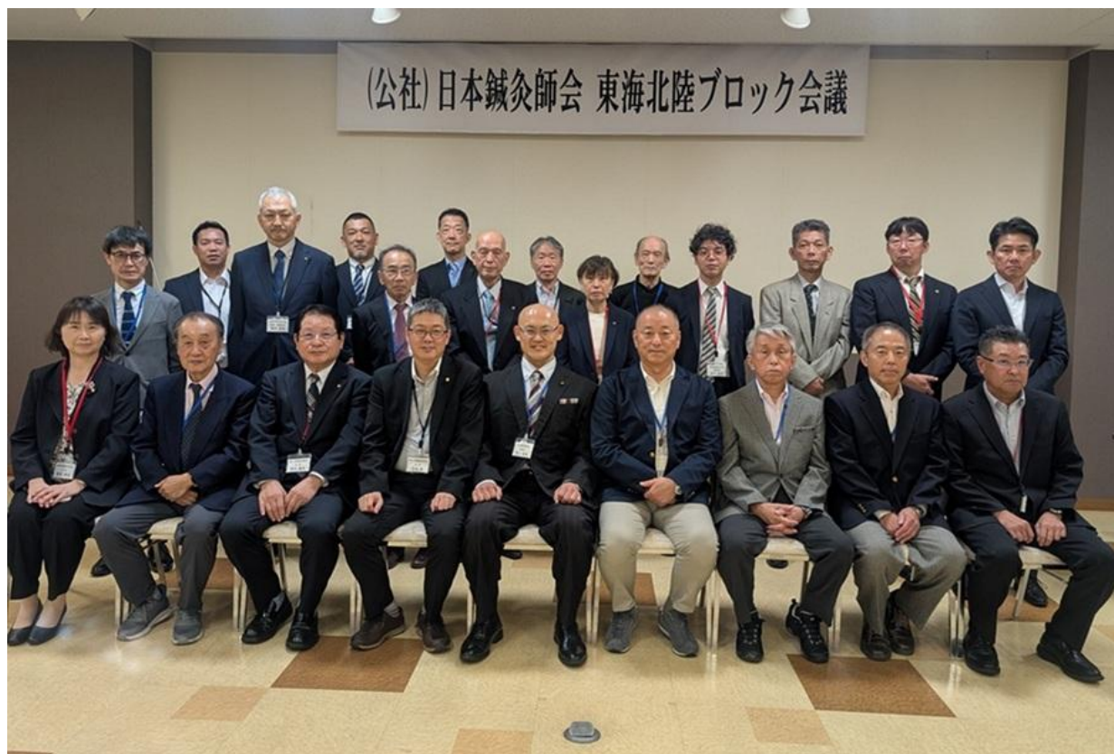
写真：「東海北陸ブロック会議 in 石川」 令和7年10月12日（日）～13日（月・祝）